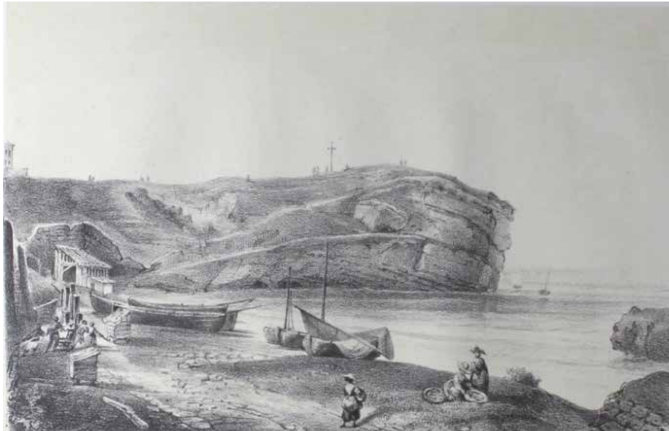
Blanche Hennebutte-Feillet Biarrits. Port des Pêcheurs Lithographie, vers 1850 Médiathèque de Bayonne